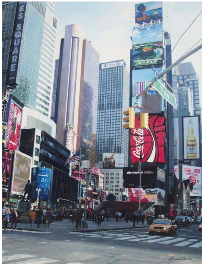
Times Square 7ª Avenida (Nueva York) O.s.t. 65 x 81 cm.