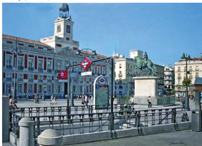
Puerta del Sol (Madrid). O.s.t. 81 x 60 cm.