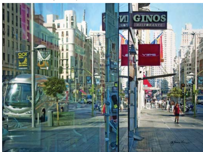
Reflejos en escaparate Gran Vía (Madrid). O.s.t. 81 x 60 cm.