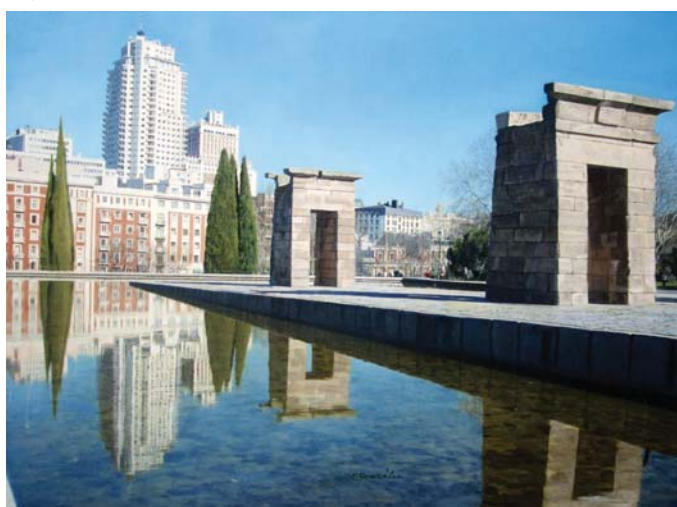
Reflejos en Templo de Debot (Madrid). O.s.t. 81 x 60 cm.