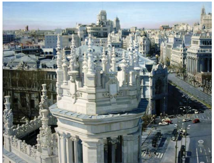
Torreón Palacio de Correos (Madrid). O.s.t. 100 x 81 cm.