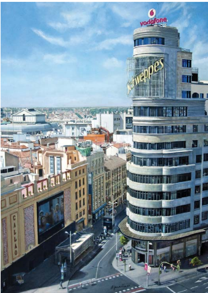
Edificio Capitol, Callao (Madrid). O.s.t. 73 x 92 cm.