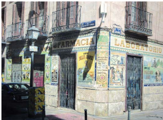
Vieja Farmacia (Madrid). O.s.t. 81 x 60 cm.