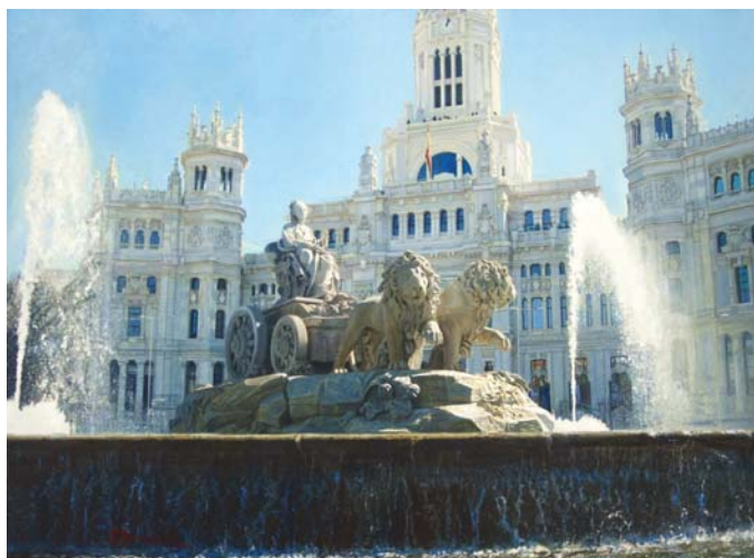
La Cibeles (Madrid). O.s.t. 81 x 60 cm.