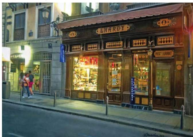
Lhardy (Madrid). O.s.t. 73 x 54 cm.